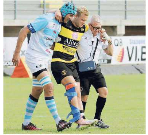
Ormsen esce dal campo con la gamba destra fratturata