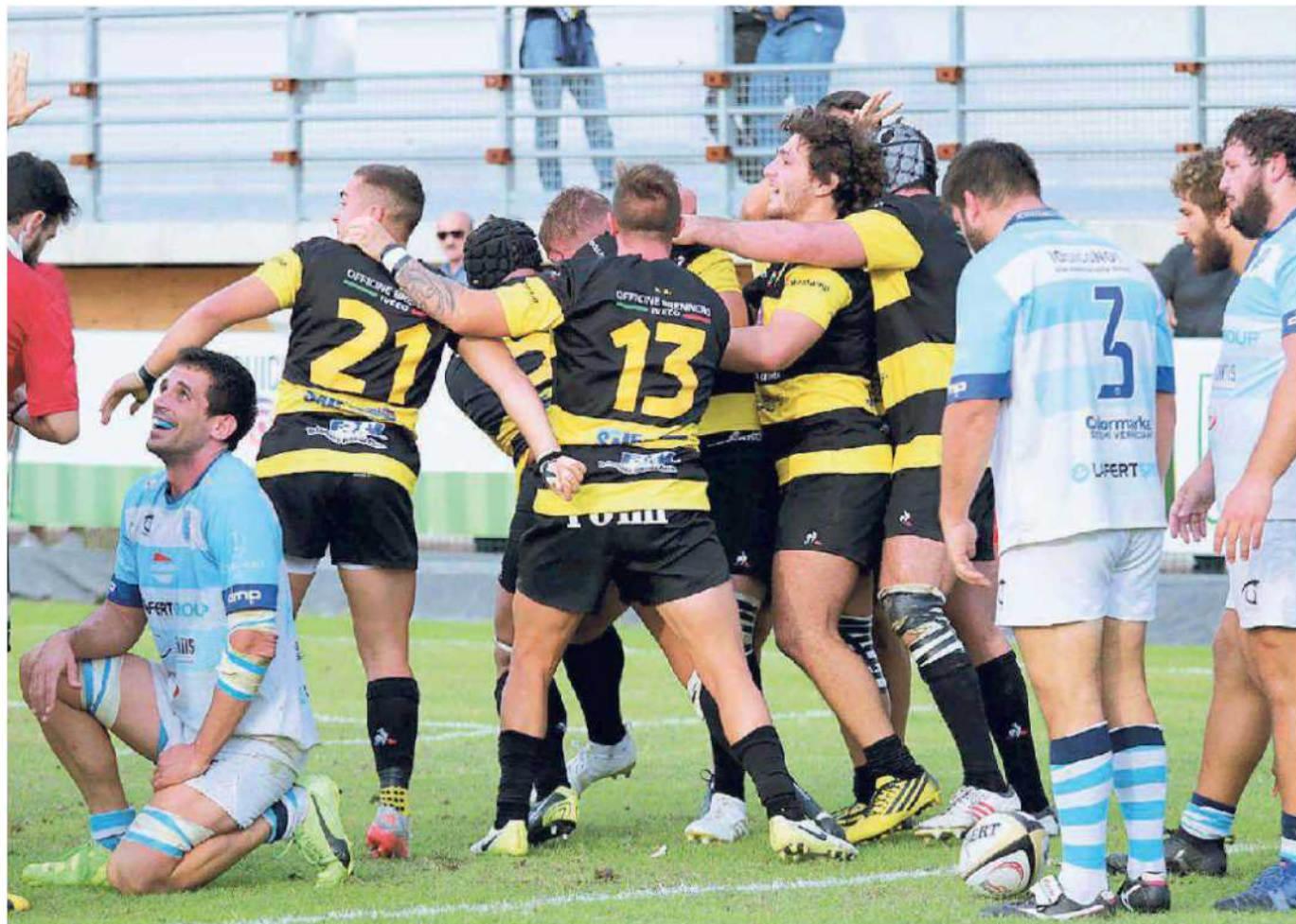
Il Viadana esulta dopo una delle tre mete realizzate. A fianco, una percussione dei gialloneri contro il San Donà