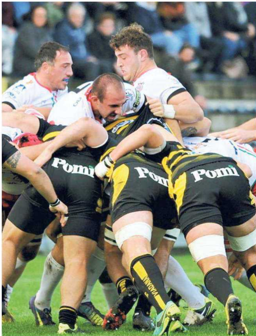
Una delle mischie del match tra Viadana e Rugby Reggio